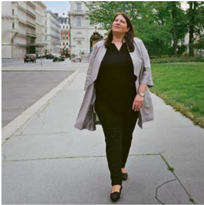
Kathrin Gaál ist Vizebürgermeisterin der Stadt Wien und als Stadträtin zuständig für den Wohnbau